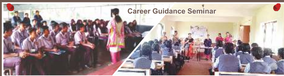
Career Guidance Seminar