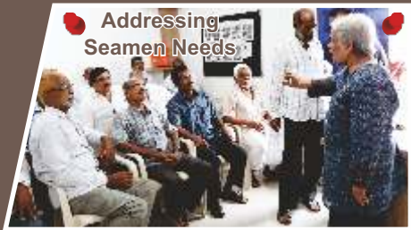
Addressing Seamen Needs